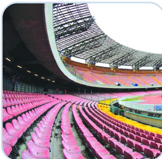
Uno scorcio dello stadio San Paolo