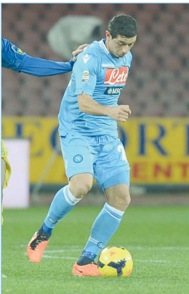
Blerim Dzemaili (Tetovo, 12 aprile 1986)